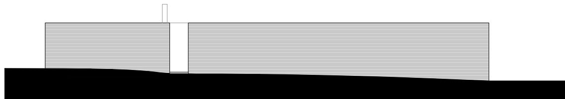
EDIFÍCIO DA EQUIPE DE GESTÃO DO PARQUE - PERFIL 2.2'